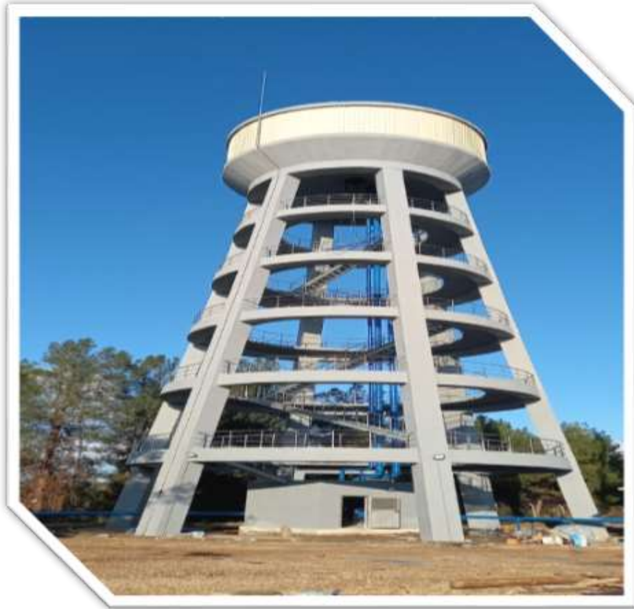
Kampüs Ayaklı Su Kulesi ve Hastane Su Deposu Yapım İşine Ait Görsel 1