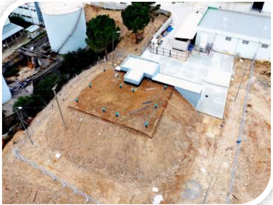
Kampüs Ayaklı Su Kulesi ve Hastane Su Deposu Yapım İşine Ait Görsel 2