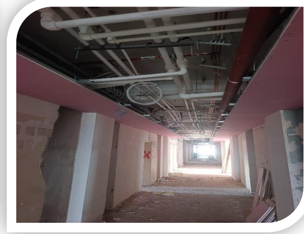
B Blok Deprem Güçlendirme projesine ait görseller