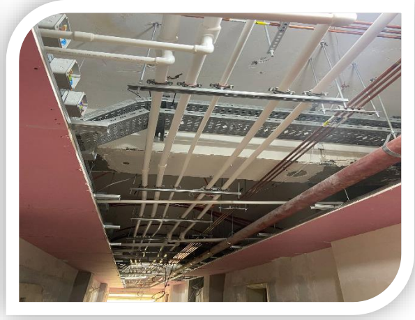
A Blok Deprem Güçlendirme projesine ait görseller