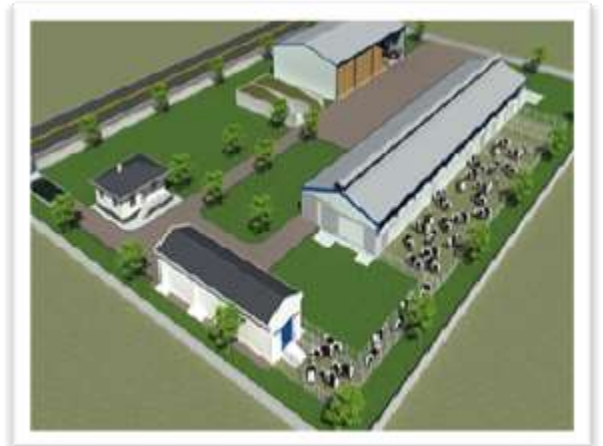
Süt Sığırcılığı Tesisi Yapımının Projesine Ait Görsel

Üniversitemiz Ziraat Fakültesine bağlı olacak Süt Sığırcılığı Tesisi yapım işine ilişkin ihale süreci 2019 yılında yapılmış olup, projenin yapımına 2020 yılında başlanmıştır. Tesis 38.000 m 2 yüz ölçümüne sahip eğitim alanı üzerine yapılacak olup, 200 adet büyük baş hayvanın barına bileceği kapasitede olacaktır.