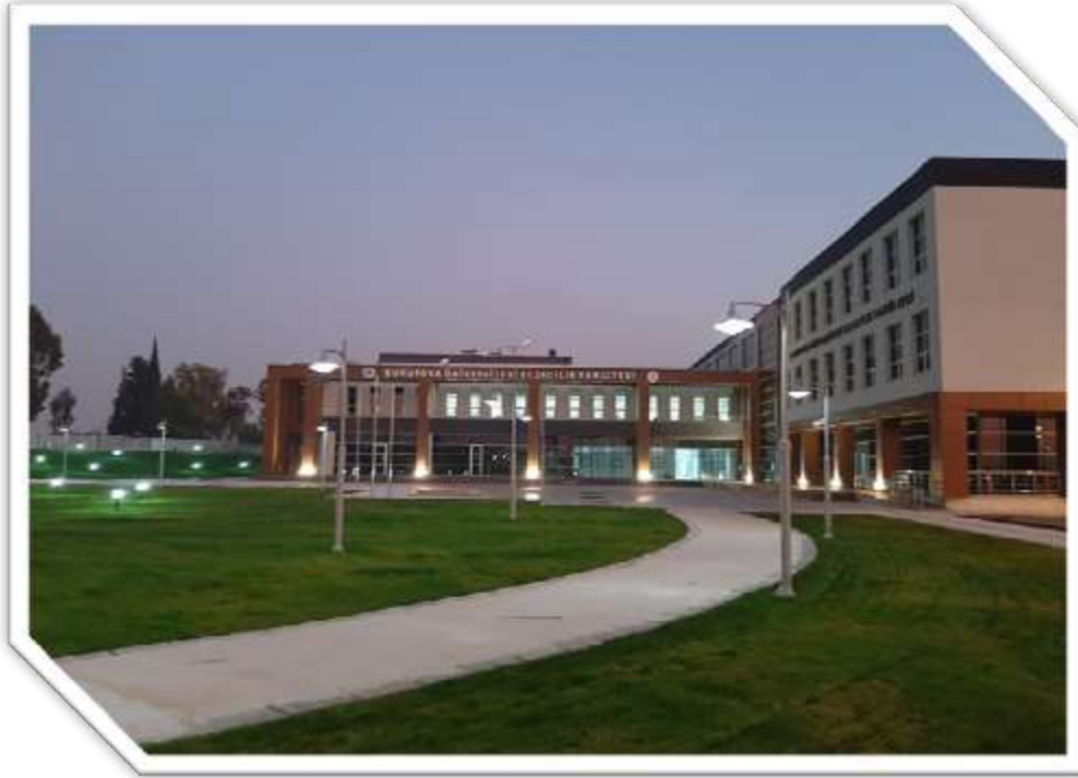
Eczacılık Fakültesi Binası Yapımına Ait Görsel

Üniversitemiz Eczacılık Fakültesi, 2011 yılında Bakanlar Kurulu Kararı ile kurulmuştur. Fakültemiz hizmet binası ihtiyacı için yapım işi ihalesi 2017 yılında yapılmış ve 08.08.2017 tarihinde sözleşmesi imzalanarak işe başlanmış ve yapımı 2019 yılında tamamlanmıştır. Eczacılık Fakültesi bünyesinde 3 bölüm, 13 anabilim dalı ve 2 bilim dalını barındırmaktadır. Tamamlanan iş sonucunda Derslik ve Merkezi Birimlerimizde 16.000 m 2 eğitim alanı olarak kapasite artışı sağlanmış, öğretim üyelerine ve öğrencilere daha kaliteli eğitim olanağı sunulmuştur.