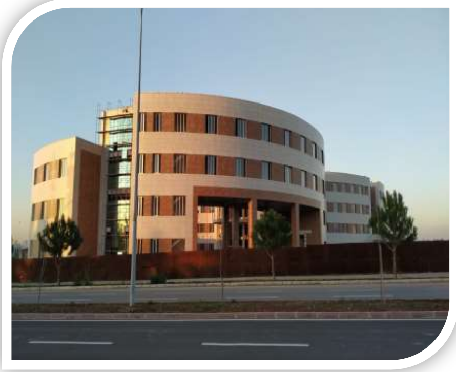
Güzel Sanatlar Fakültesi Binası Yapımına Ait Görsel

Üniversitemiz Güzel Sanatlar Fakültesi, 1993 yılında Bakanlar Kurulu Kararı ile kurulmuştur. Fakültemiz hizmet binası ihtiyacı için yapım işi ihalesi 2017 yılında yapılmış ve 27.07.2017 tarihinde sözleşmesi imzalanarak işe başlanmış ve yapımı kaba inşaat aşamasında olup, fiziki gerçekleşme oranı %81'dir. Yapımı 2020 yılında tamamlandığında 15.000 m 2 alanı ile kendi hizmet binasına kavuşan fakültemizin hem öğrenci kapasitesi arttırılmış hem de daha donanımlı eğitim ve öğretim verilerek Üniversitemiz gelişim sürecine katkı sağlanmış olacaktır.