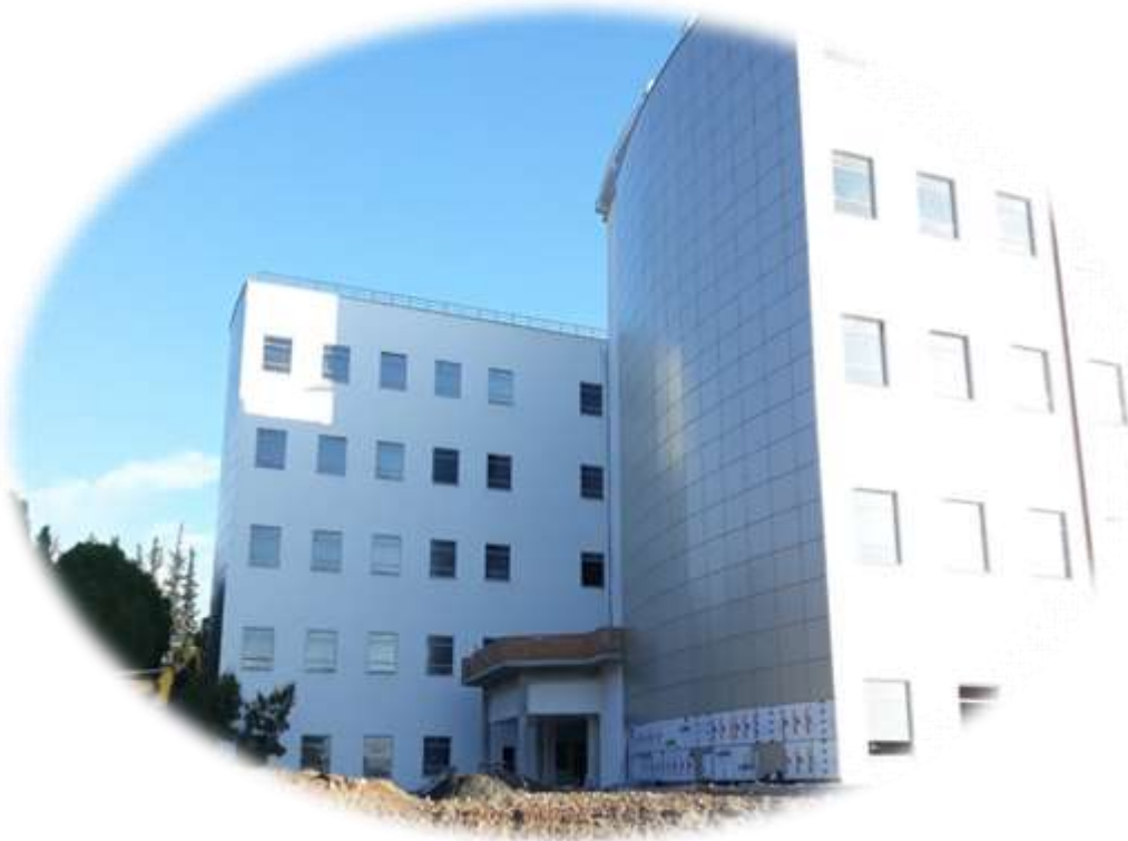
Onkoloji Hastanesi Binası Yapımına Ait Görsel

Projenin amacı, erişkin ve çocuk hasta grubu için hematoloji ve onkoloji bilim dallarında daha donanımlı ve kaliteli hizmet vermektir. Ayrıca 18 adedi kemik iliği nakli ünitesine ait olmak üzere toplam 190 hasta yatağına sahip sağlık alanında kaliteli hizmet sunmaktır.