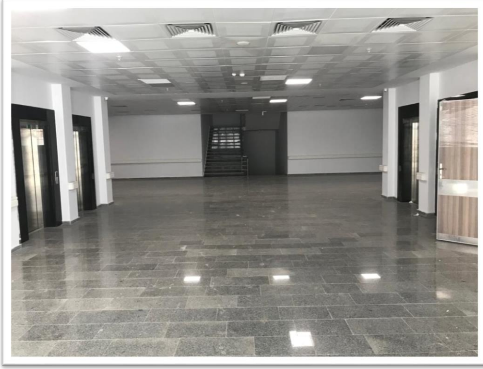
Onkoloji Hastanesi Binası Ait Görsel 1