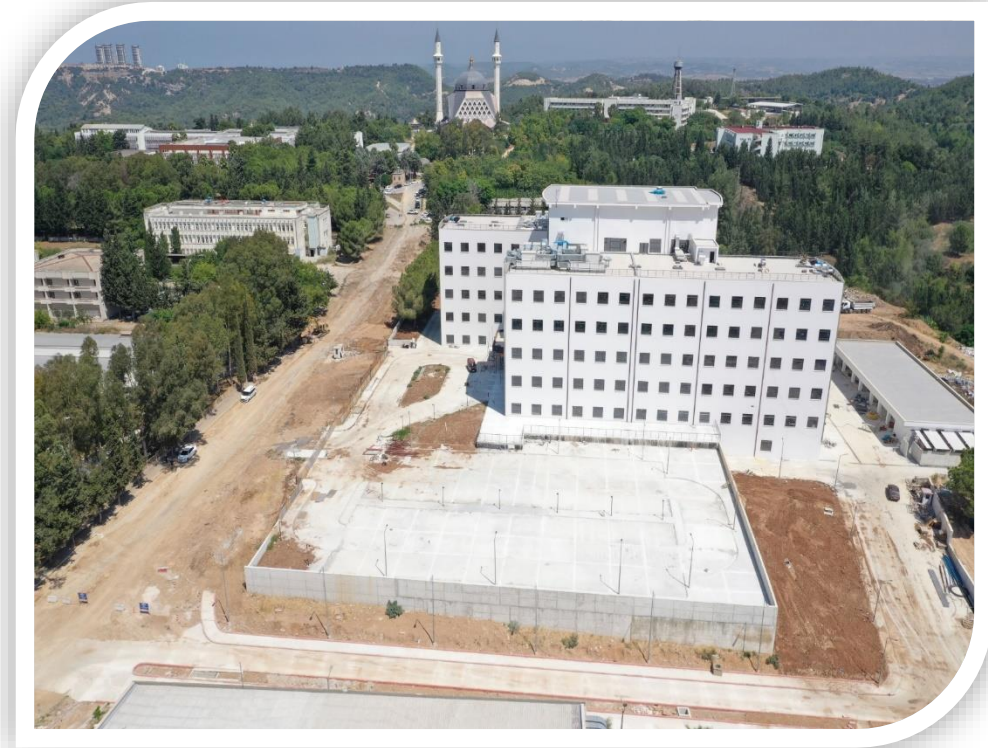
Onkoloji Hastanesi Binası Ait Görsel 2