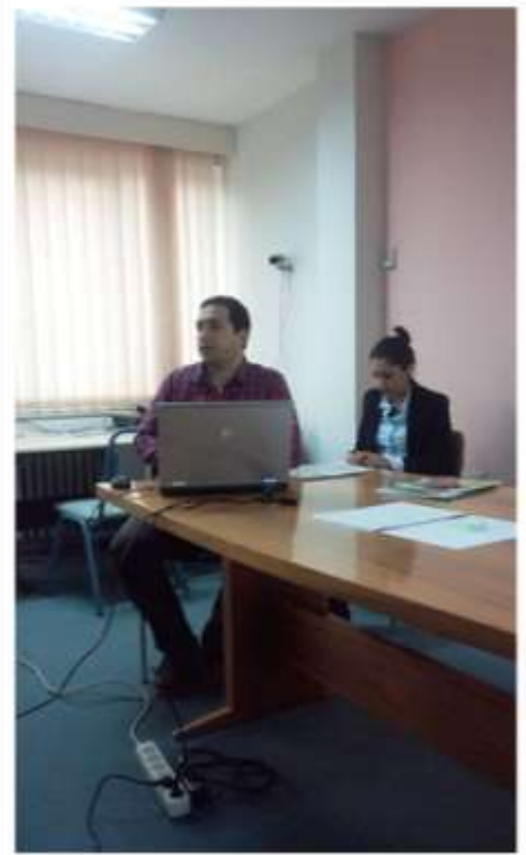
Strateji Geliştirme Daire Başkanlığı